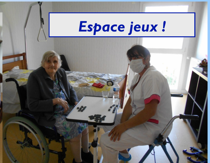
Espace jeux !