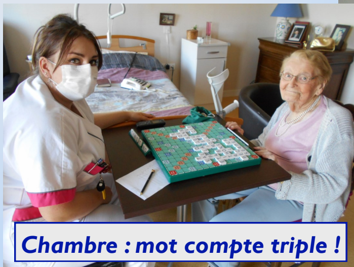
Chambre : mot compte triple !