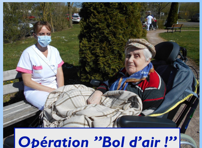
Opération "Bol d'air !"