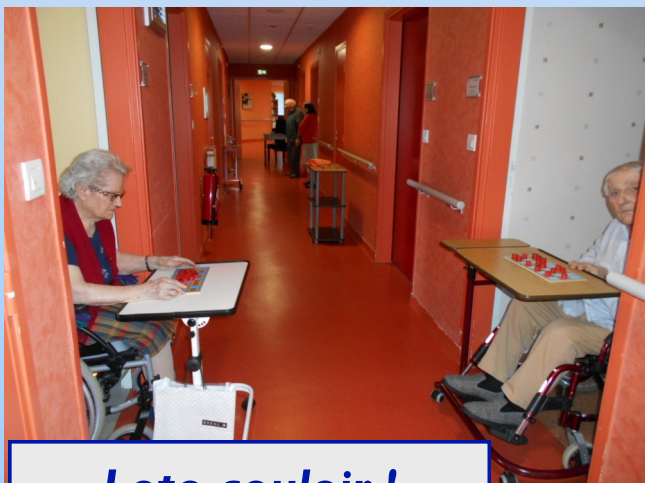
Loto couloir !